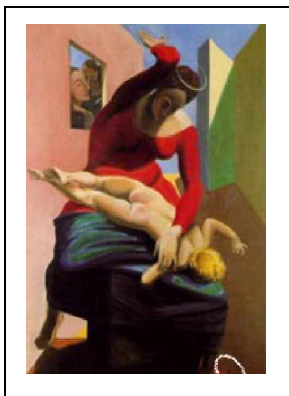
Bild: Max Ernst, „The Virgin Spanking the Christ Child before Three Witnesses“ - in Postkartengröße hier: http://pulp.bluecircus.net/archives/005683.html

Und der Friede Gottes, der höher ist als alle Vernunft, bewahre unsere Herzen und Sinne in Jesus Christus, unserm Herrn. Amen.